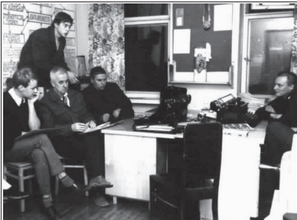
Johtajaneuvosto toimistolla 1967.

van Karhujen virallinen osoite on Väinölänkatu 26.