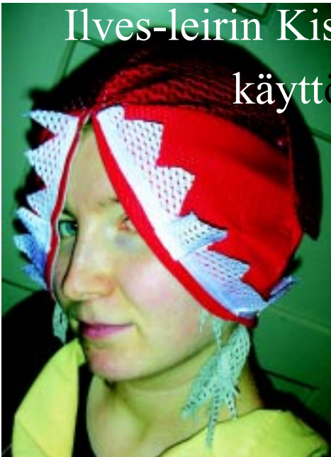
Susi on syönyt punahilkan isoäidin