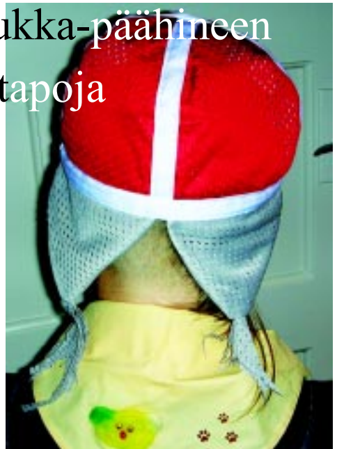
Tanskalainen partiolainen Helka-Hirnuinen