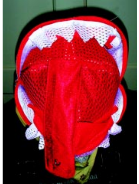
Hard rock miau