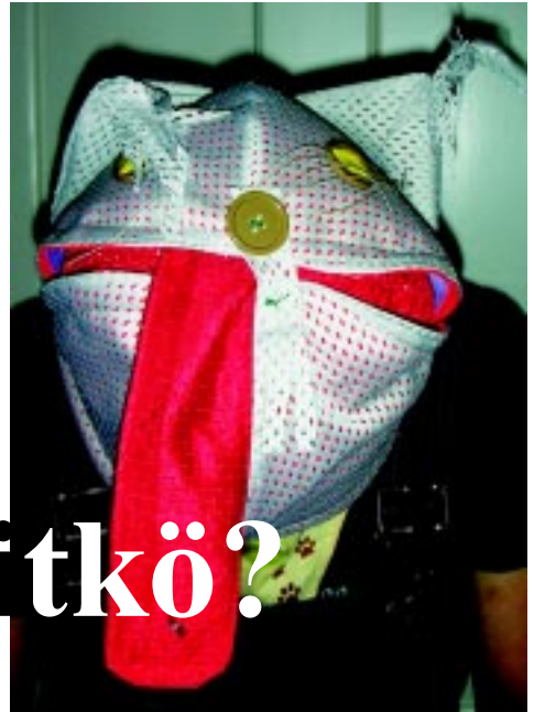
Kuuman kesän ilves