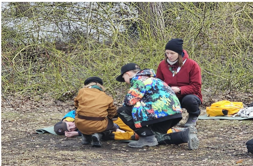
Kuva ensiapurastilta

Kisa oli kaikin mielin kiva ja hauska, kun matkattiin rastilta rastille ratikan kyydissä. Kerron nyt oman vartioni matkareitin ja mitä teimme. Kisa alkoi Kalevan kirkolta. Siellä suoritimme kätevyystehtävän eli teimme laudasta ratikan pienoismalli. Kirkolta suuntasimme Pyynikintorille ja sieltä vielä Santalahden päätepysäkille asti. Santalahdessa tehtävämme oli arvioida eri matkojen pituuksia linnunreitin mukaan Tampereen suosittuihin paikkoihin, kuten Näkötorille, Pyynikille. Sieltä palasimme kirkolle, kokkasimme herkullista ruokaa ja jatkoimme matkaa kohti Hervantaa.